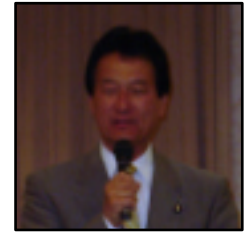
衆議院議員 大島敦様