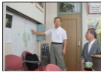
地図の前で説明する岩崎市長

主要記事 桶川市長表敬訪問 = 1・5面 新役員就任ご挨拶 = 4・5・6・7面