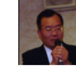
上尾市長 島村穰様 代理 上尾市副市長 後藤文男様