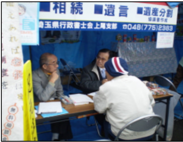
本年も11月、あげお祭り会場(上尾市民体育館)で行政書士無料相談会を開催します=写真は19年11月の相談会の様子

(前頁から) 費は577、742円(対売上比10・16%)でした。前職のころより営業における広告宣伝の重要性は十分認識しているつもりであり、今後多少リスクがあっても惜しむつもりはありません。