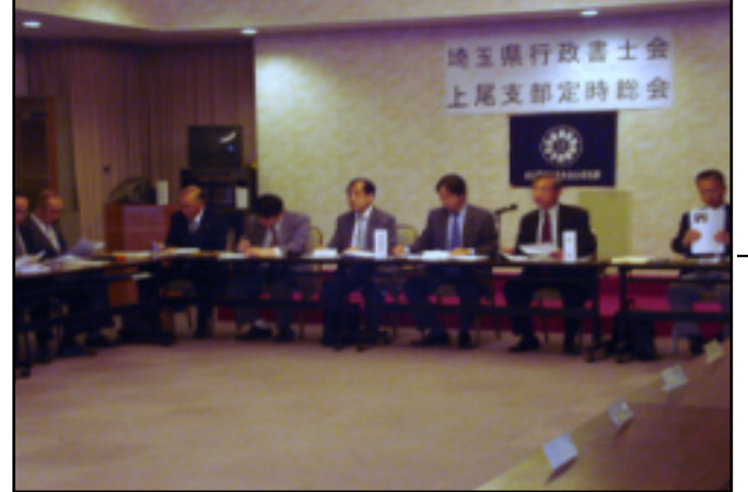
総会に臨む支部執行部=5月1日、上尾市内