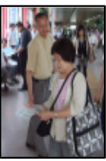
相談会当日の広報活動(上4枚)

最後に行政書士会の「事業と暮らしの相談」等による市民サービスの充実を期待する旨のお話がありました。支部長からは6月27日の「べに花まつり」に合わせに行った桶川駅での街頭無料相談の報告と市長の期待に込められた一層市民サービスの強化する旨の決意を述べ、訪問を終えました。