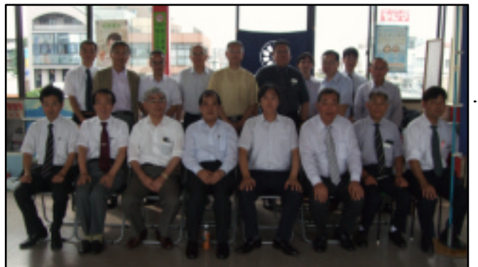
相談会に参加した上尾支部の行政書士 = 6月27日、桶川駅