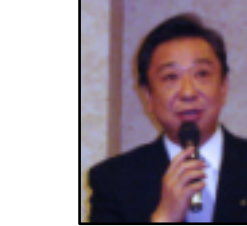
埼玉県議会議員 石渡豊様