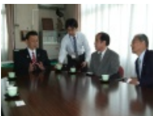
会談する桶川市長(左)と秋山支部長(右)