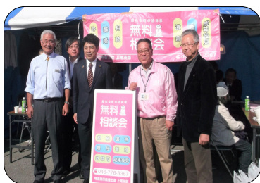
衆議院中根一幸議員と