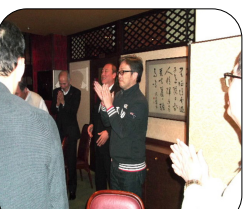
野中副支部長の締め

冬季研修会後上尾駅近くの中華料理店にて忘年会が行われました。皆で美味しい料理やお酒を前にあつという間の2時間でした。