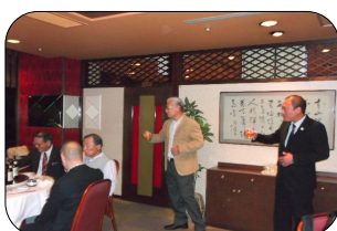
高村副支部長による乾杯