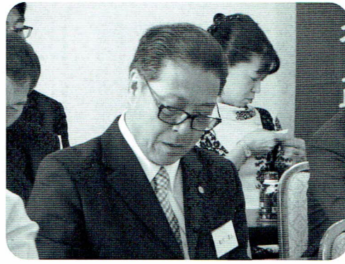
質疑応答をする船川支部長