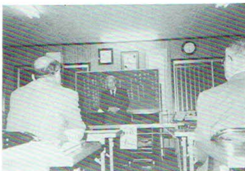
▲上尾支部総会で挨拶する荒井松司市長

平成元年度定期総会は、上尾市長荒井松司氏、県議会議員青木利文氏、上尾市議会議員新橋保氏、柳井真太郎氏、佐野昭夫氏、矢部克氏、岡野喜一氏、上尾市役所市民相談室長野村孝晴氏、大宮支部長代理神津氏のご臨席を得て、午後6時より上尾支部事務局（長島事務所内）に於て開催された。