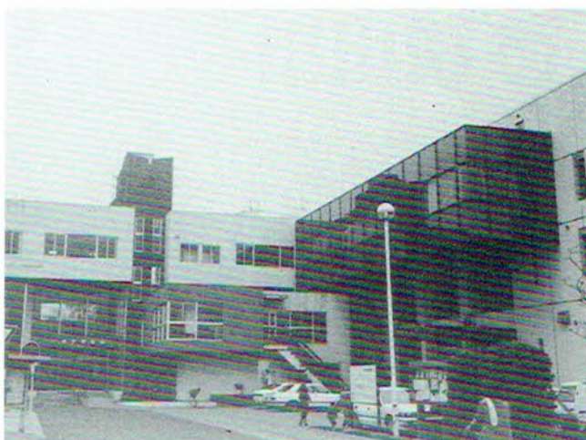
▲伸び盛りの町伊奈を象徴して明るい落ちつきを見せる町役場