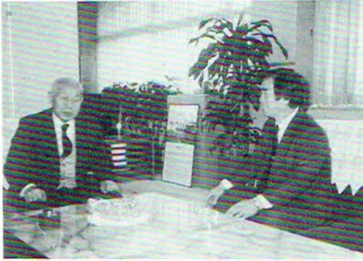
▲上尾市長と懇談する長島支部長