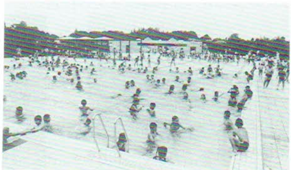
▲平成元年夏完成したプールでは、今年も子どもたちの歓声が城山公園中に響きわたりそう。