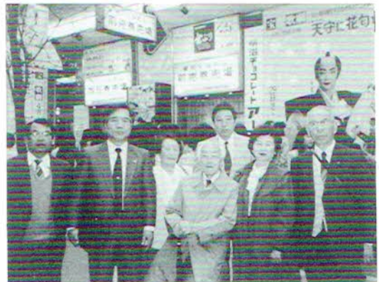
▲宝塚劇場入口にて

元年度最後のレクリエーションは、宝塚歌劇を観賞、一同若さと華やかさを満喫したひとときでした。