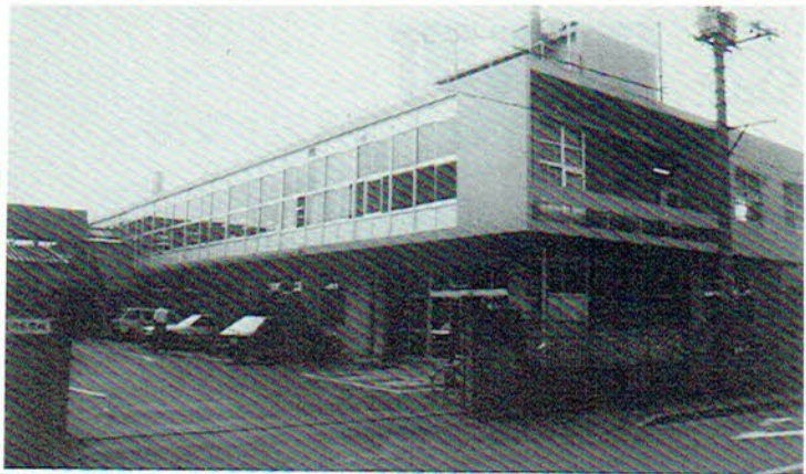
▲“平和で活力ある文化都市”桶川は、今秋市政施行20周年。新旧住民の市役所に寄せる期待も大きい。