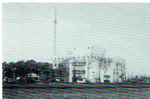
▲クリーンセンター 公害防止、環境保全技術を取り入れたゴミ焼却場