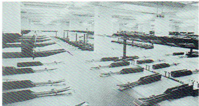
▲市自慢の桶川駅西口地下自転車大駐車場

人口（平成元年12月1日現在） 総数 68,356人 男 34,440人 女 33,956人 世帯数 20,429世帯 面積 25.25 km 2 出張所 1（桶川駅前mineの中）