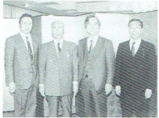
▲知知事を囲む研修会会場にて