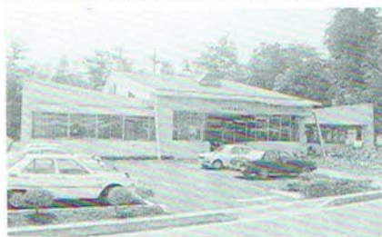
▲教養の発信基地、町民の書斎、図書館