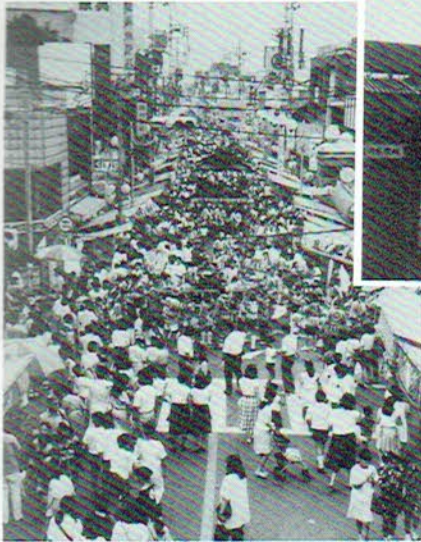
◆住民の交流の場、夏まつり、市民まつり