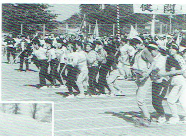
▲総合体育祭、町民健康マラソン、町民駅伝大会、伊奈まつり、総合体育祭など、町民交流の場がいっぱい。