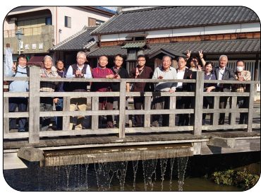
佐原の街並みで集合写真