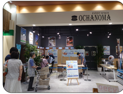
盛況で待ちの行列ができました