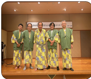
上尾支部の参加者

埼玉県行政書士会主催の研修旅行が9月30日、10月1日に、福島県郡山市の磐梯熱海温泉で行われました。上尾支部からは5名の会員が参加しました。