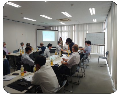
グループワーク形式の研修会

いう時にはこうあるべきと考えることが怒りの感情を生むとの講師の言葉が強く印象に残っております。