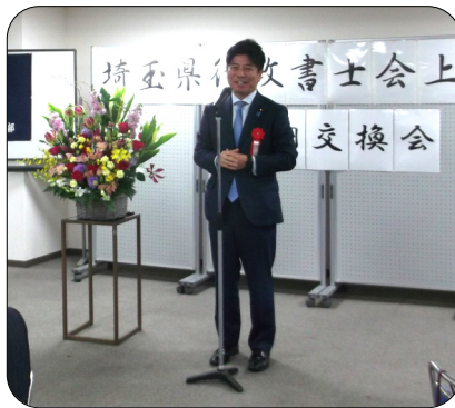
衆議院議員 中根一幸様