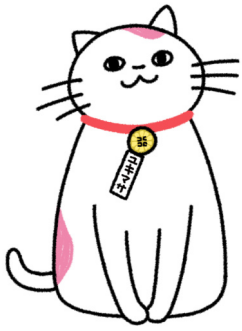
日本行政書士会連合会 公式キャラクターユキマサくん