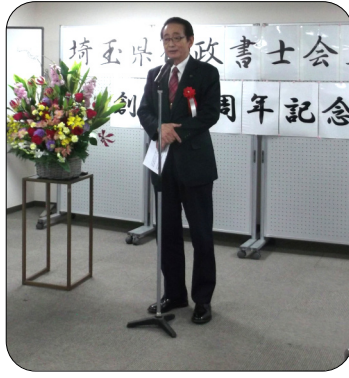
上尾市長 畠山稔様

上尾市長 桶川市長 伊奈町長 衆議院議員 衆議院議員 衆議院議員 衆議院議員 衆議院議員 衆議院議員 衆議院議員 衆議院議員 伊奈町商工会議所会頭 埼玉県行政書士会副会長 埼玉県行政書士会大宮支部支部長 埼玉県行政書士会鴻巣支部支部長 埼玉県行政書士会鴻巣支部副支部長