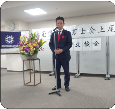
衆議院議員 三ツ林裕巳様