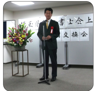
衆議院議員 大島敦様