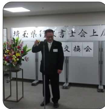
乾杯の音頭をとる船川政連支部長